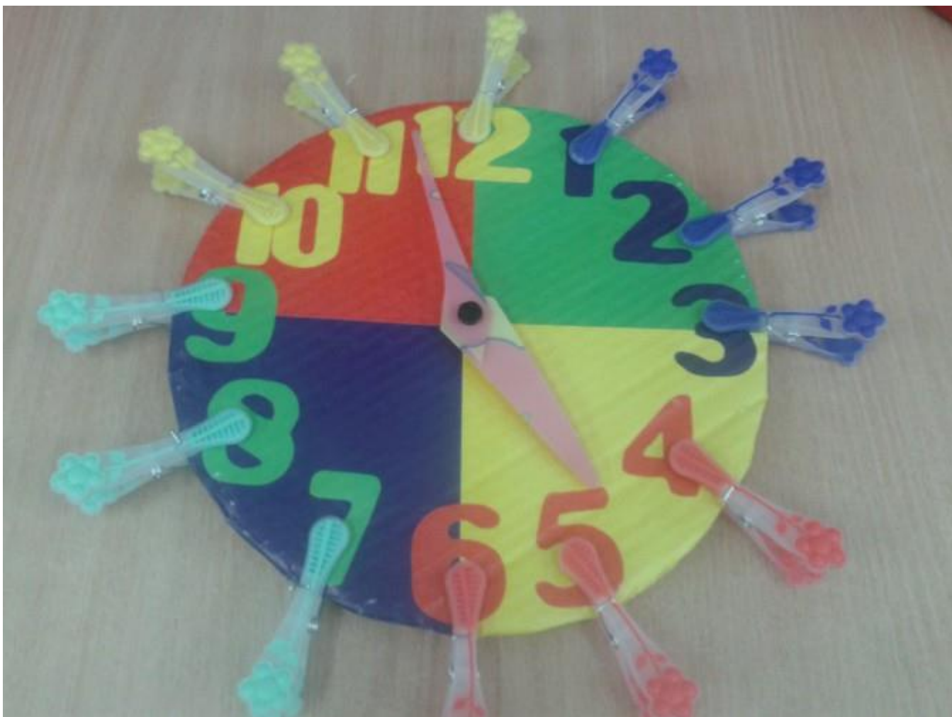
Игра "Волшебные часики" (на закрепление цвета, прямого счета в пределах 5, развитие мелкой моторики ).